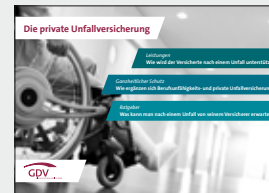
Die private Unfallversicherung