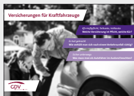
Versicherungen für Kraftfahrzeuge