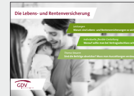
Die Lebens- und Rentenversicherung