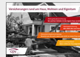
Versicherungen rund um Haus, Wohnen und Eigentum