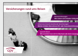
Versicherungen rund ums Reisen