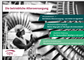
Die betriebliche Altersversorgung