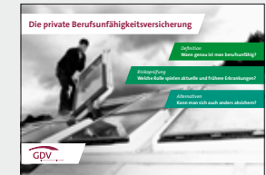
Die private Berufsunfähigkeitsversicherung