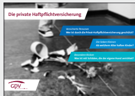
Die private Haftpflichtversicherung